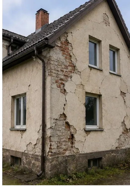
صورة رقم 2 نظرة عامة على الأضرار الخارجية الموثقة أثناء الفحص