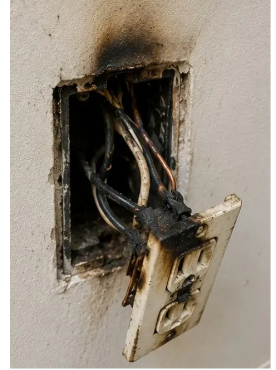
صورة رقم 12 أضرار النظام الكهربائي المسجلة أثناء الفحص