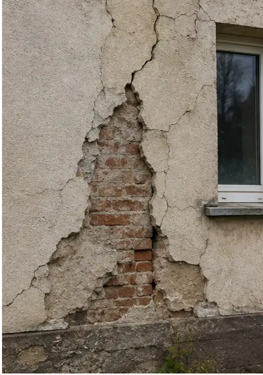
صورة رقم 4 أضرار الجدار الخارجي الموثقة للتقييم