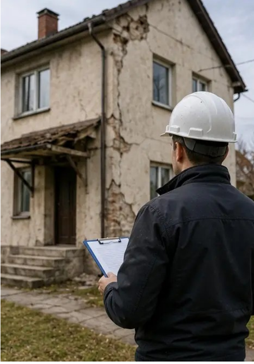
صورة رقم 16 الصورة الختامية لمُلخص فحص الأضرار