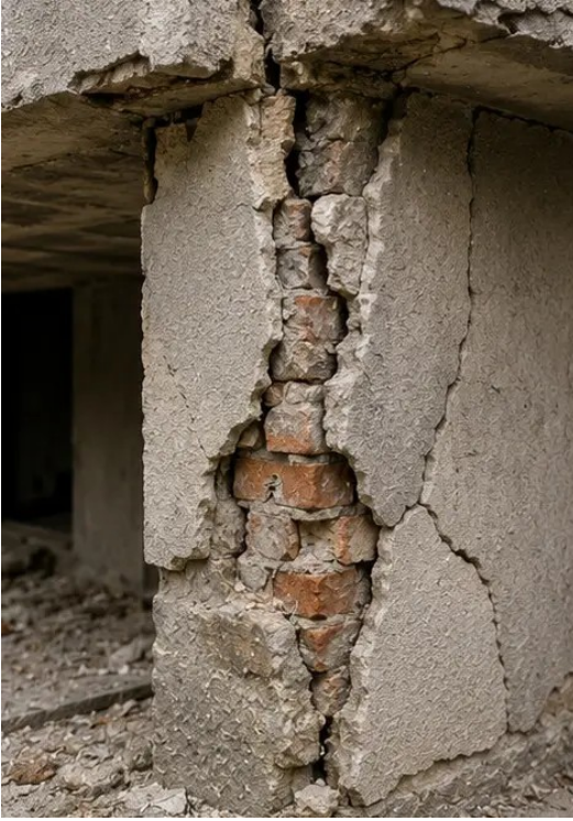
صورة رقم 13 تفاصيل الأضرار الإنشائية الموثقة للتقييم