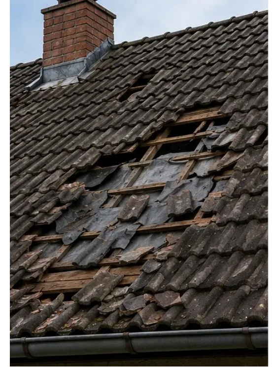
صورة رقم 3 منطقة السقف المتضررة المحددة والمسجلة